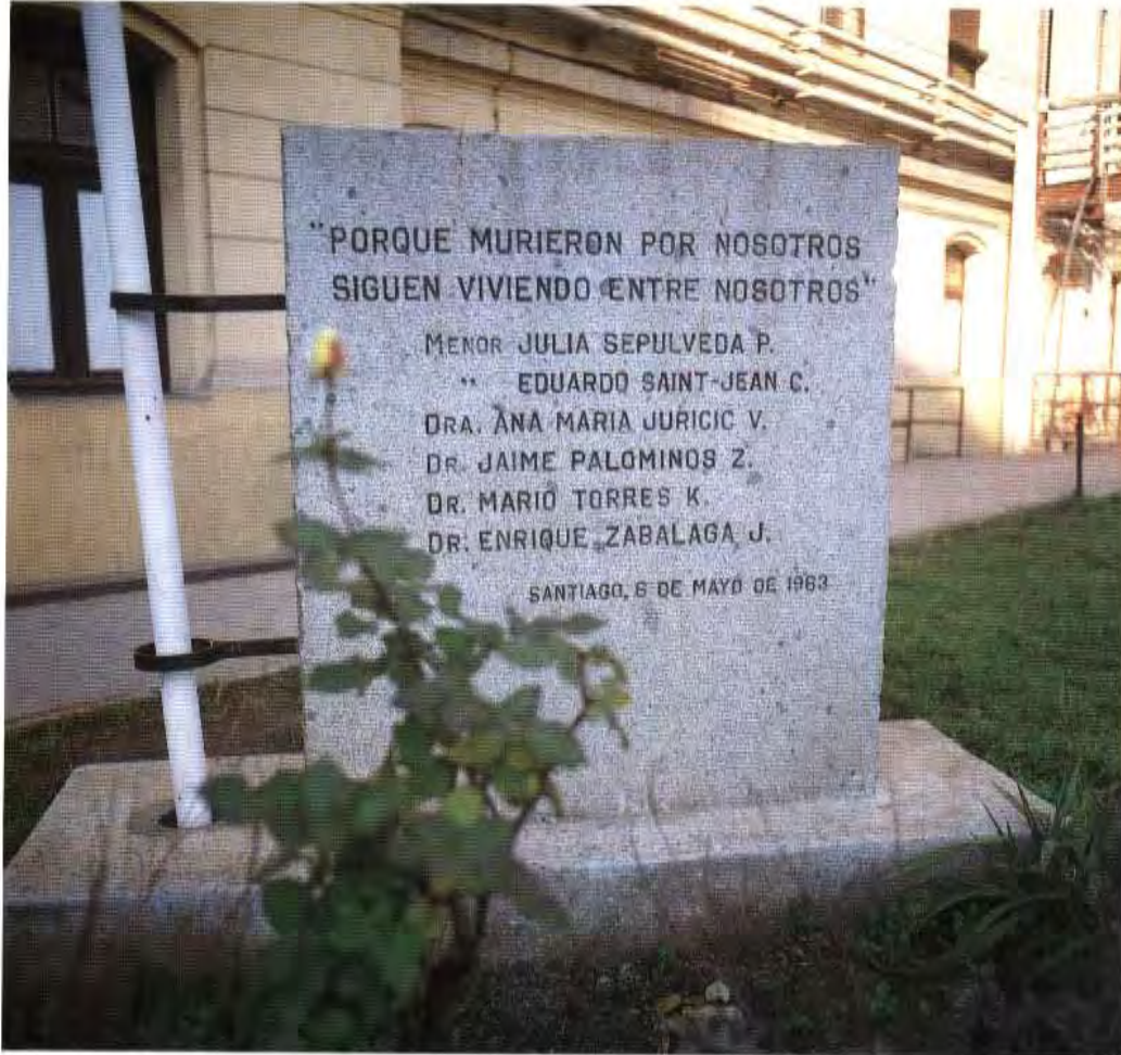
Homenaje de conmemoración de la tragedia en el Hospital de Niños "Manuel Arriarán"