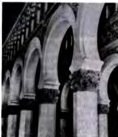
Interior de la Iglesia de Santa María la Blanca, de típico estilo mudéjar. Toledo, España.

–"Este Profeta no conversa sobre la mujer sino con delicadeza y educación. Se esforzó siempre en mejorar su situación y en elevar su condición. Las mujeres, antes de Mahoma, no heredaban, sino que eran consideradas objetos que, al morir sus esposos, las heredaban los hombres más cercanos, como si fueran hacienda o esclavas. Cuando surgió el Profeta, abolió esa situación, liberó a la mujer y le otorgó el derecho a heredar. Mahoma liberó a la mujer árabe y quien desee investigar sobre la preocupación de este Profeta por la mujer, que lea su último sermón pronunciado en Maccah, en el que encargó ser magnánimos con las mujeres" ( Orientalista francés ).